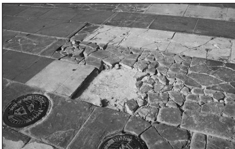
Prima dei lavori.

Quindi altre vie e strade si trovano in situazioni pessime, non certo fiore all'occhiello di una Amministrazione che ha fatto del "bello" la sua arma vincente.