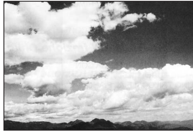
«I suoi occhi erano aperti [...] Sopra di lui non v'era che il cielo: l'alto cielo, infinitamente profondo... "Perché non ho io visto questo cielo prima d'ora? ..."» (L. Tolstoj in Guerra e Pace ).

occhi erano aperti [...] Sopra di lui non v'era che il cielo: l'alto cielo, infinitamente profondo, e nuvole grigie che vi scorrevano in fuga. "Non è così, -pensava il principe Andrej.- Non era così tacito e tranquillo, quando io accorrevo; non era così, quando noi accorrevamo gridando e com-