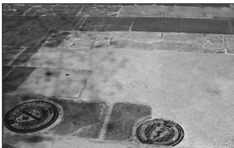
Dopo i lavori di sistemazione con materiali in cemento.