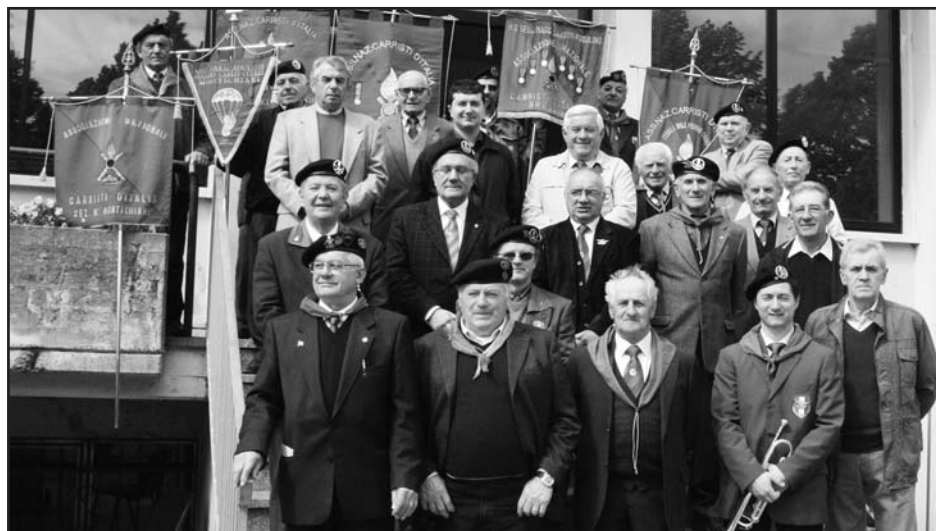
I partecipanti al raduno all'uscita del Ritrovo S. Francesco.