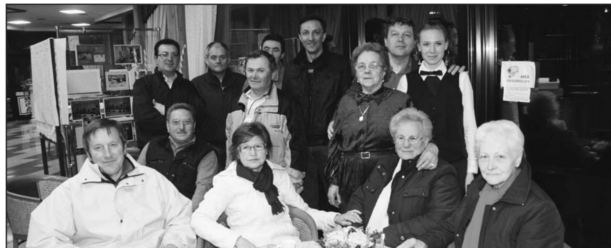
Alcuni degli organizzatori della Sagra.

gno. Come tradizione, il Comitato invita tutti i residenti delle frazioni a partecipare alla messa in onore della Croce, prevista per sabato 5 maggio alle ore 19, presso la chiesa di S. Pancrazio.