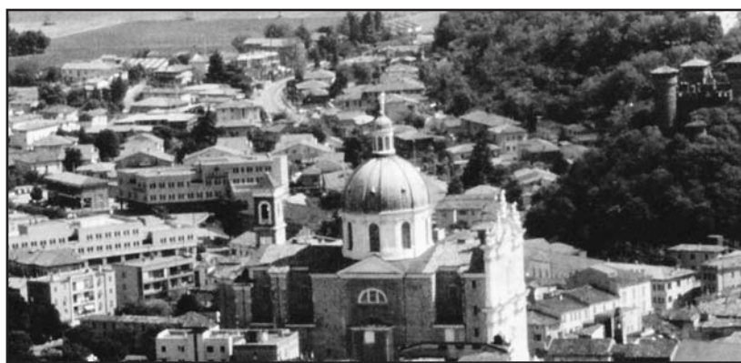
Occorrono scelte amministrative che salvaguardino la nostra bella Montichiari.