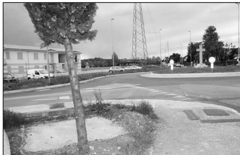
In primo piano la base della croce nella sua collocazione originale.