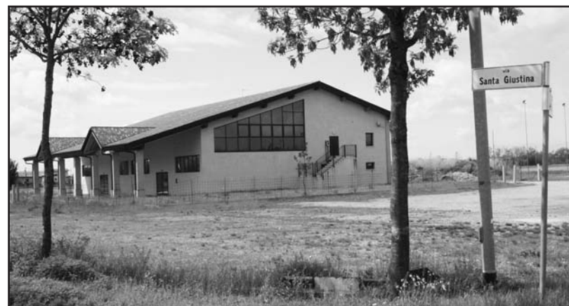
L'edificio "senza nome" in via S. Giustina.